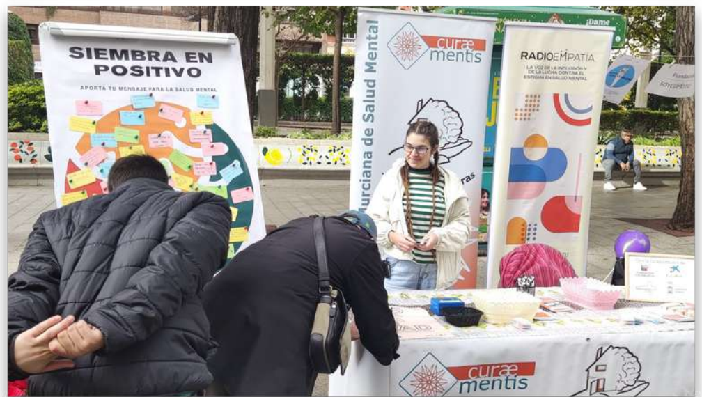
Participación en Ferias "Día Internacional de Personas con Discapacidad, Murcia" Diciembre 2022