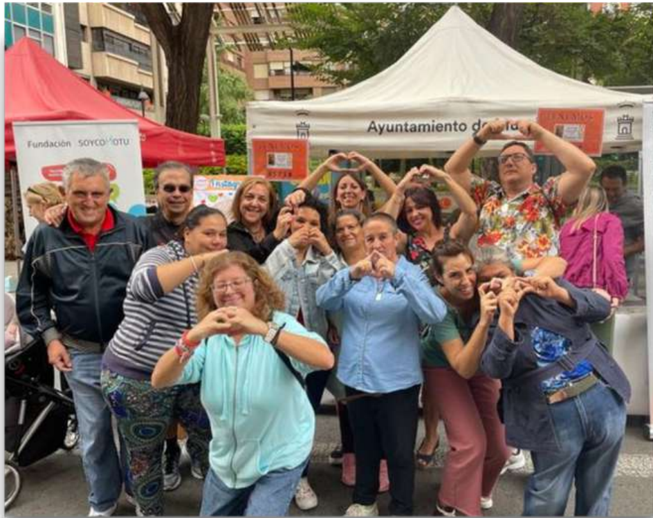
Participación en Ferias "Día Mundial de la Salud Mental en Murcia" Octubre 2022