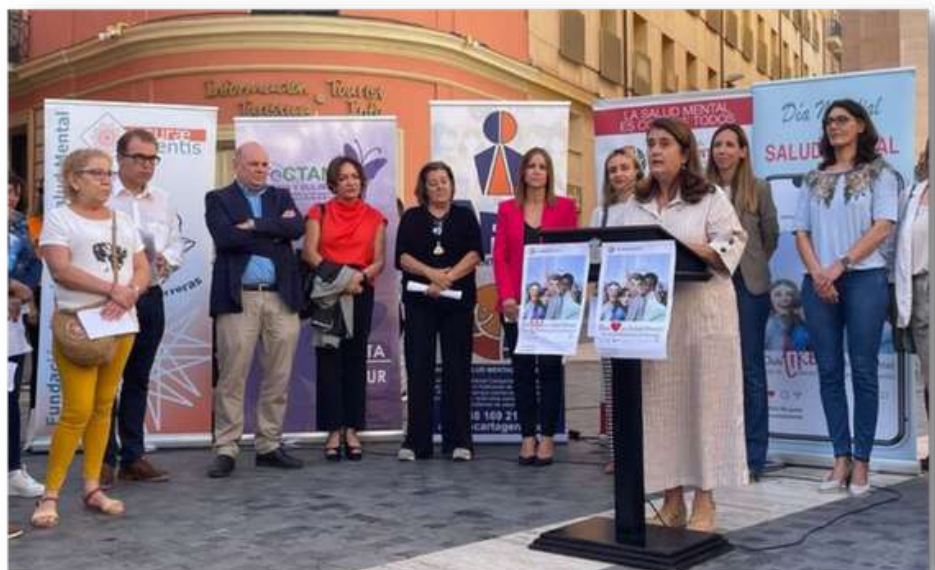
Reivindicaciones "Acto lectura manifiesto día mundial de la salud mental, Murcia " Octubre 2022