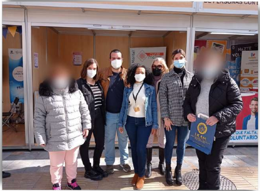
Participación en Ferias "XXI Muestra del voluntariado UCAM" Diciembre 2022