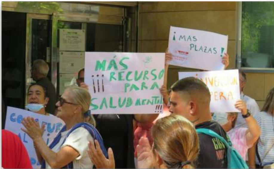
Reivindicación "Más Inversión en Salud Mental, la salud mental un derecho necesario" Septiembre 2022