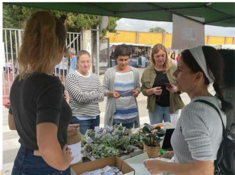
Participación en Ferias "Día Mundial de la Salud Mental en Beniel" Octubre 2022