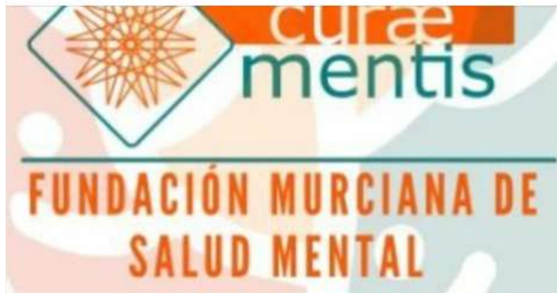
Aparición en Canales de Comunicación "Radio Sureste Cope" Septiembre 2022