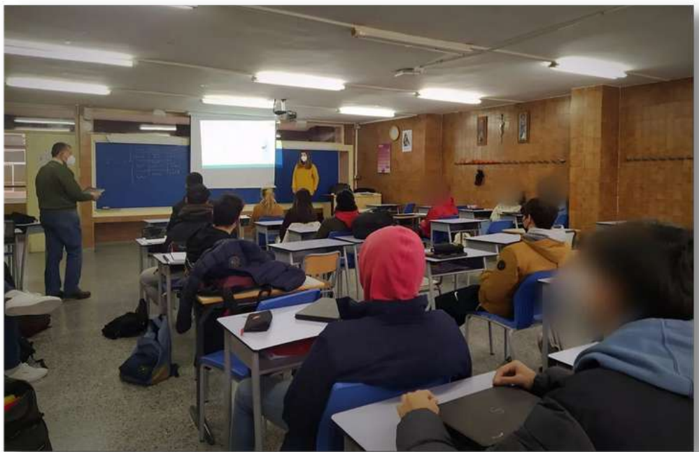
Sensibilización en Centros Educativos "Charla Colegio Sagrada Familia" Abril 2022