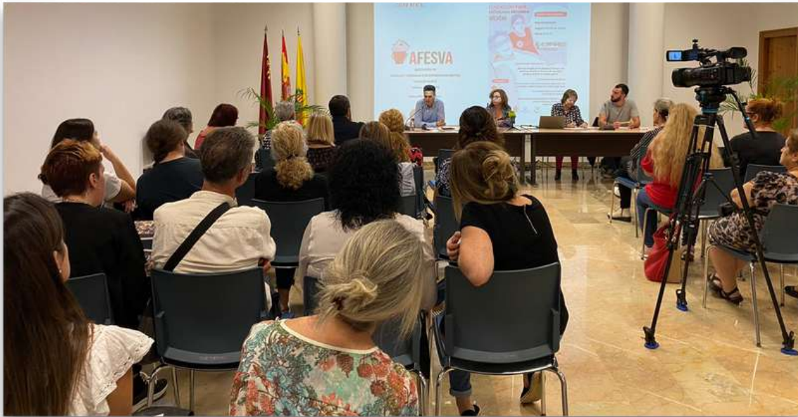
Participación en Jornadas "I Jornadas de Salud, Mental en Archena" Octubre 2022