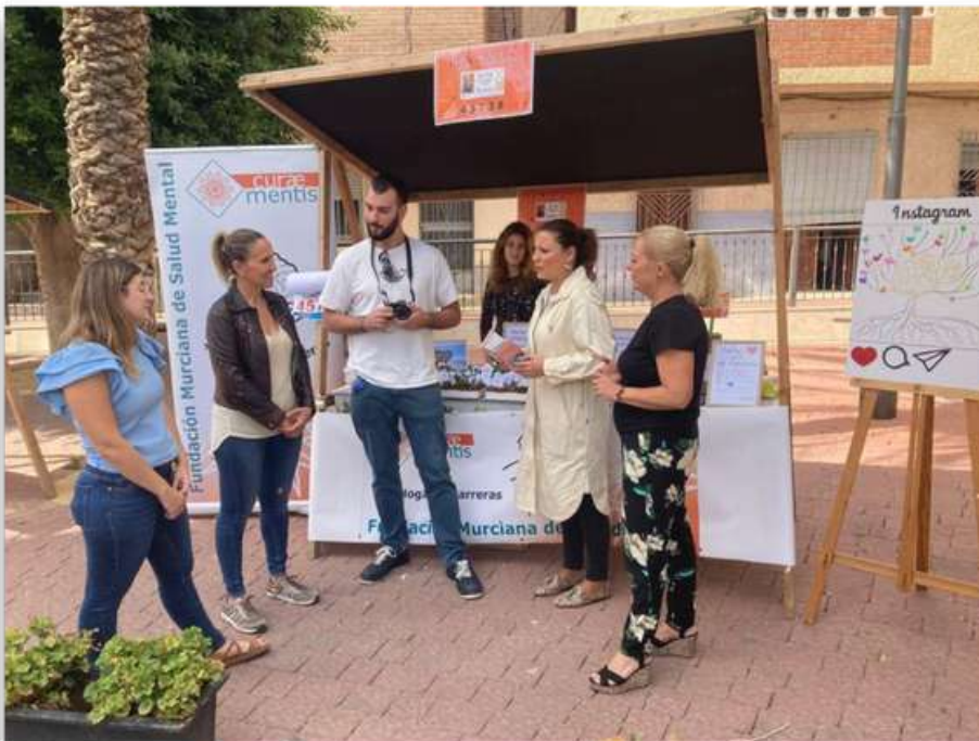
Participación en Ferias "Día Mundial de la Salud Mental en Fortuna" Octubre 2022